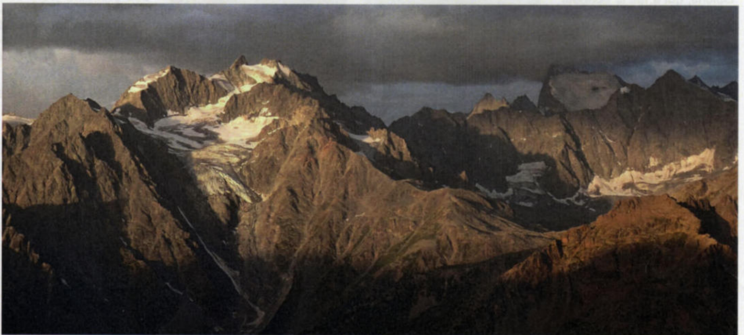
Lever de soleil sur le massif des Ecrins : on reconnaît Les Agneaux et la Barre des Ecrins (assombrie par la nuée).