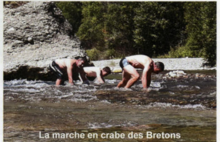
La marche en crabe des Bretons