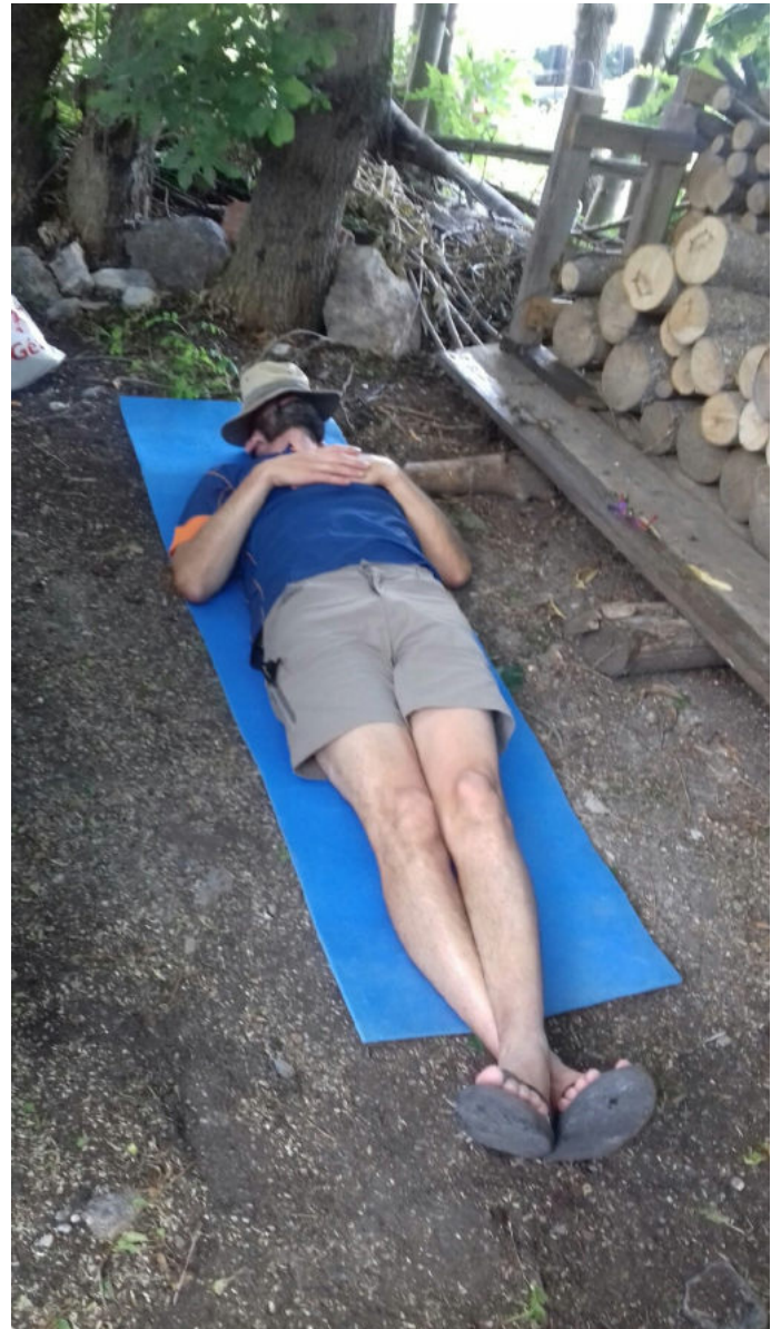
« La sieste, c'est sacré » ! (Illustration)