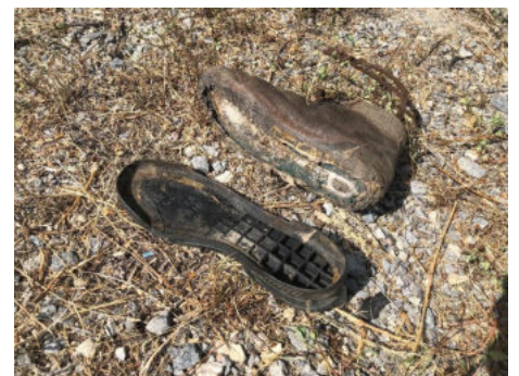
La chaussée romaine a eu raison des mal-chaussés...